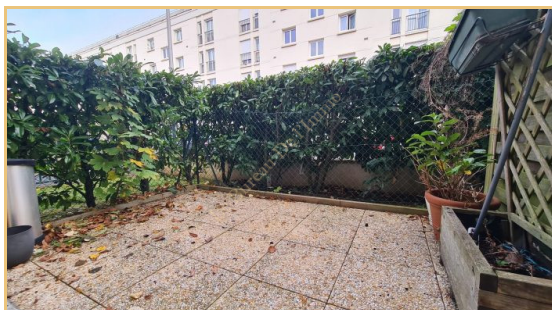
Terrasse exposée EST